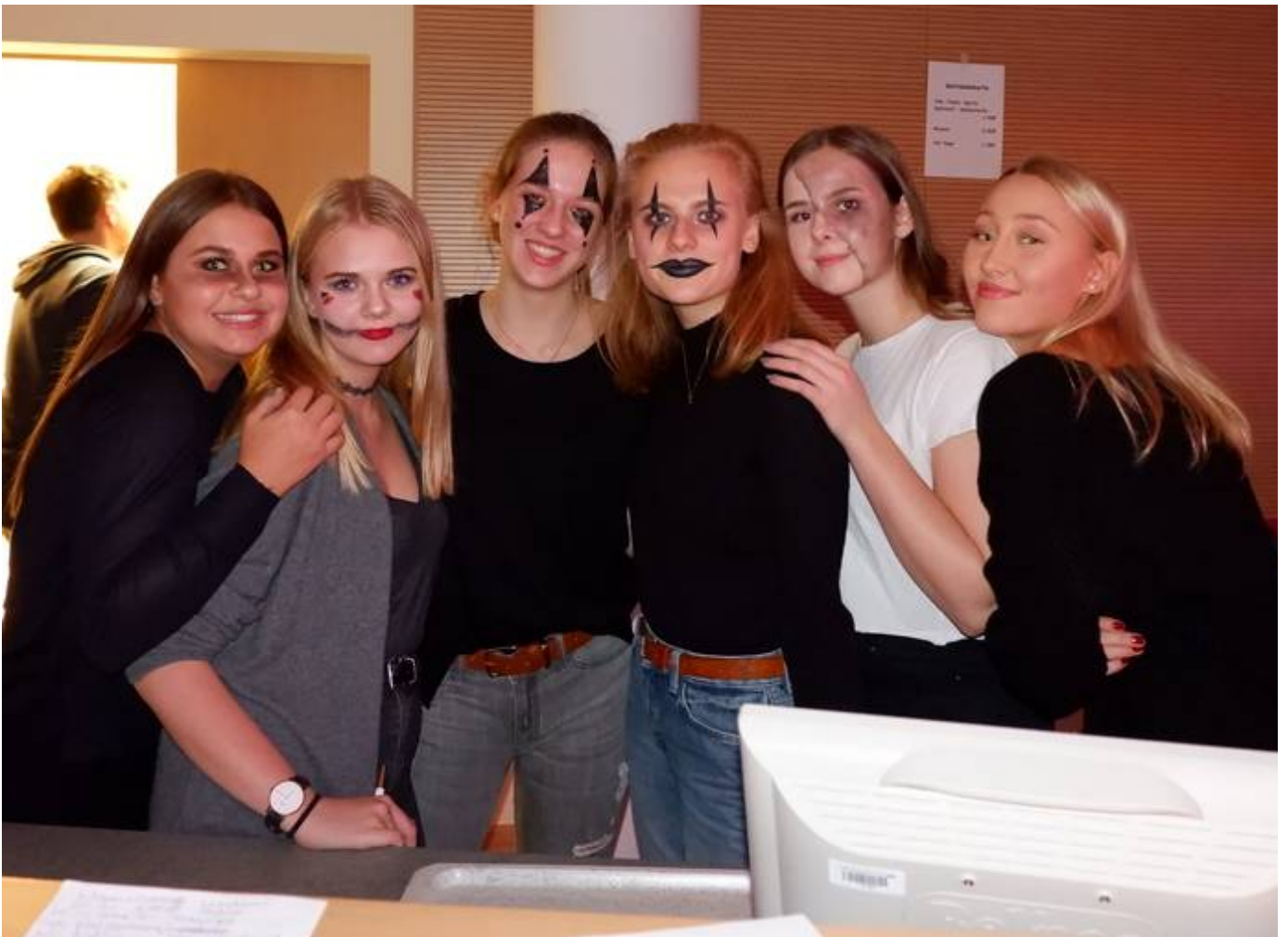
Halloween Helfer 2018